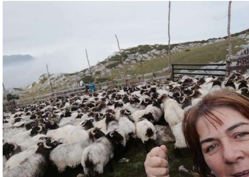
Bejes, Parque Nacional de Picos de Europa, Cantabria.

En nuestra vida laboral nos dan la opción de gestionar nuestras guías de movimiento de animales para la trazabilidad, pedir citas en la oficina de extensión agraria, contactar con los veterinarios, recibir notificaciones, controlar el movimiento del ganado en el monte momento a momento, los partos en las cuadras sin estresar a los animales desde casa, subir nuestros productos a las redes, hacer venta ‘online’ o cosas tan cotidianas como pedir una cita médica... Pero claro, todo ello implica tener acceso a una cobertura mínima. Mientras que en las ciudades se habla de 5G, aquí estamos subidos en una piedra buscando una rallita para enviar un WhatsApp.