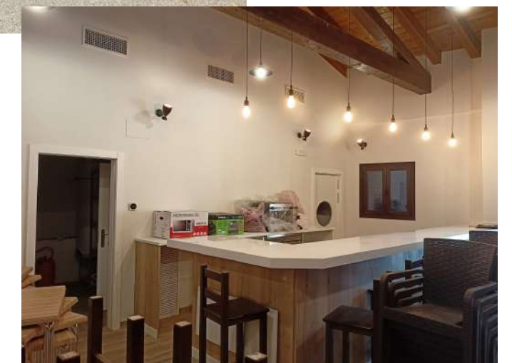
Interior del bar-centro social de Leza de Río Leza.